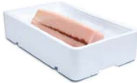
Lomo Emperador refrigerado con piel (Xiphias gladius) Chilled Swordfish loin skin on Filone Pesce Spada con pelle Longe d'Espadon réfrigéré avec peau Vacuum pack + porexbox + ice