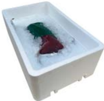
Atún lomo sin piel premium (Thunnus albacares) Tuna loin premium wrapped Filone di tonno premium garzato Longes de thon yellowfin Vacuum pack + porexbox + ice