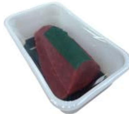
Atún lomo sin piel premium - MAP (Thunnus albacares) Tuna loin MAP Filone di tonno senza pelle ATM Longe de thon en barquette Modified atmosphere + porexbox + ice