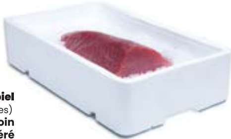
Lomo de Atún sin piel (Thunnus albacares) Chilled Tuna loin Longe de Thon réfrigéré Filone Tonno refrigerato Vacuum pack + porexbox + ice